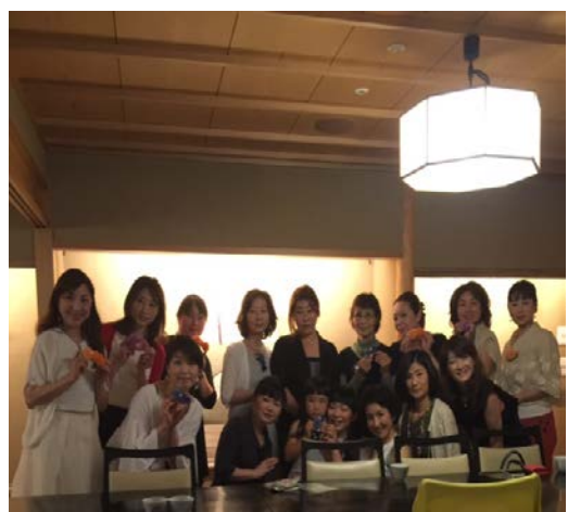
皆さまの作品と共に集合お写真！